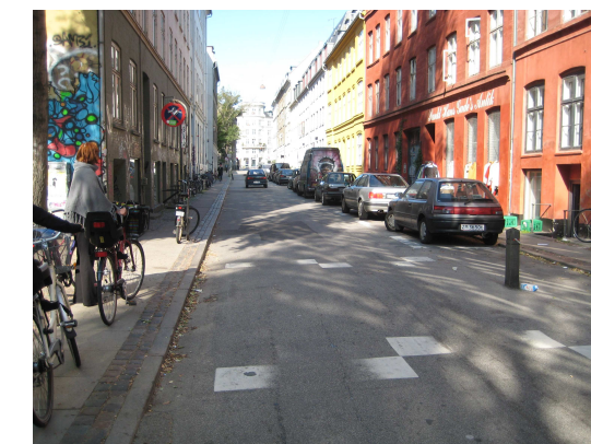
Parkerede biler på Skt. Hans Gade