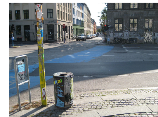
Blå cykelbane leder mod Skt. Hans Gade