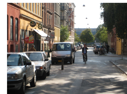
Parkering i begge sider på det sidste vejstykke