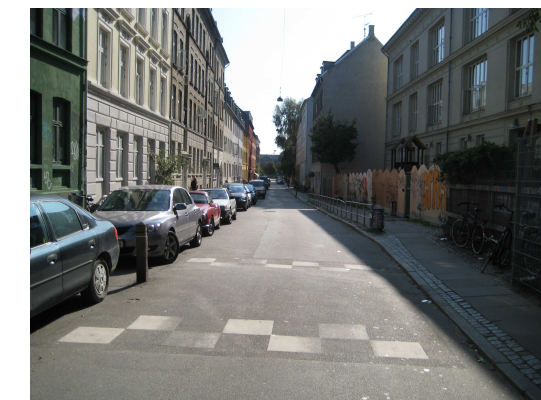
Hastighedsdæmpning foran skolen